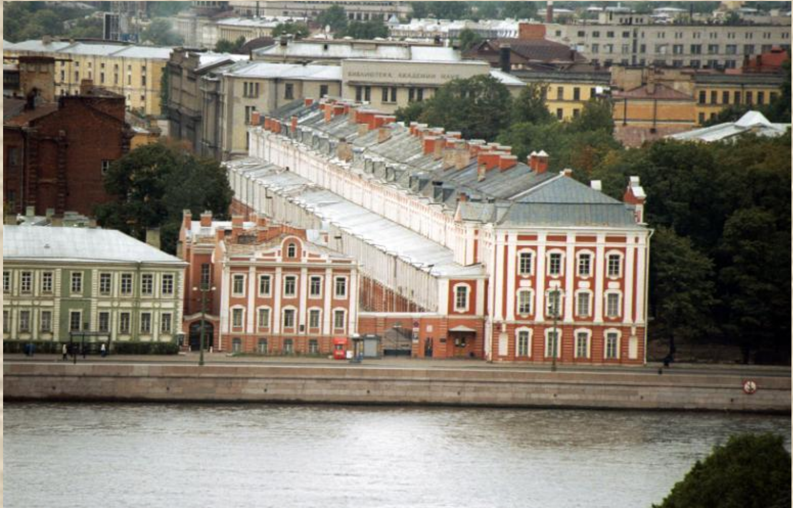
Здание Двенадцати коллегий