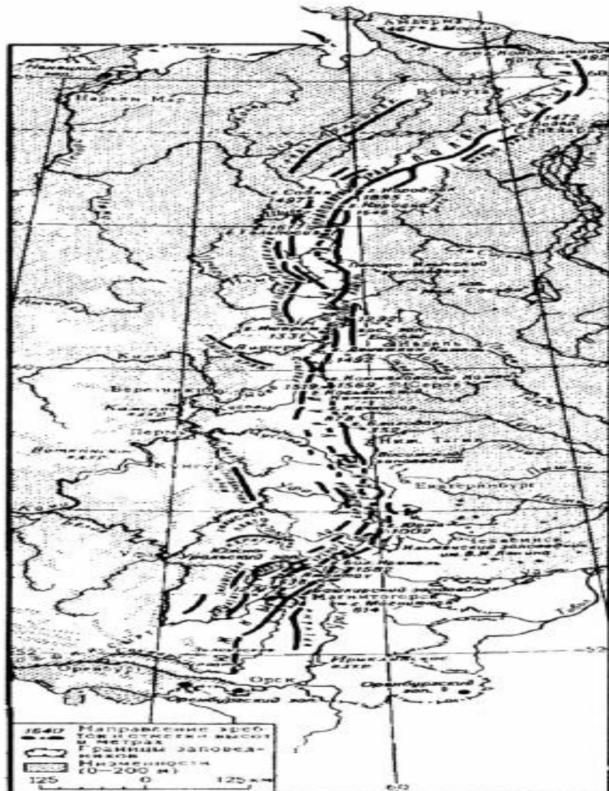
Орографическая схема Урала