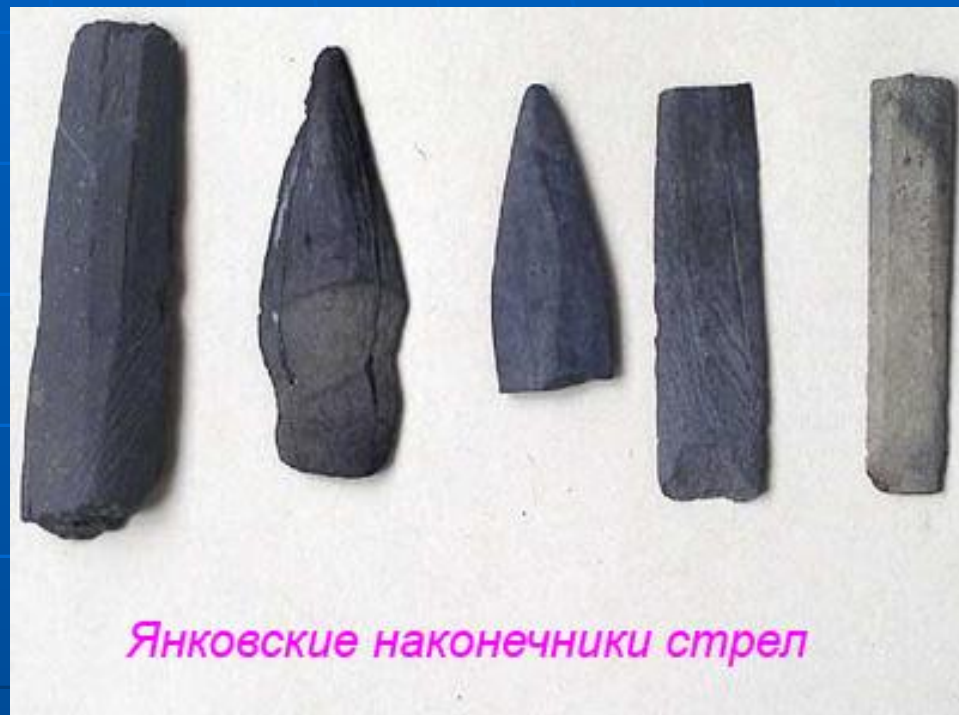
Янковские наконечники стрел