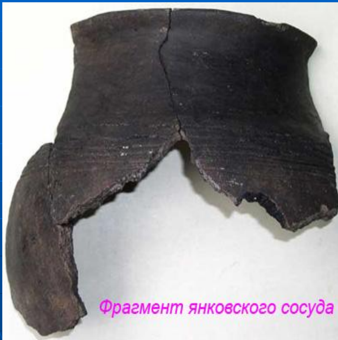
Фрагмент янковского сосуда