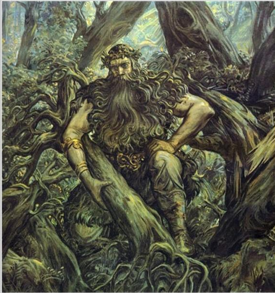
Художник: Клименко А.