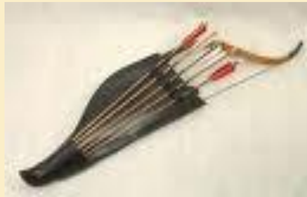
Колчан со стрелами