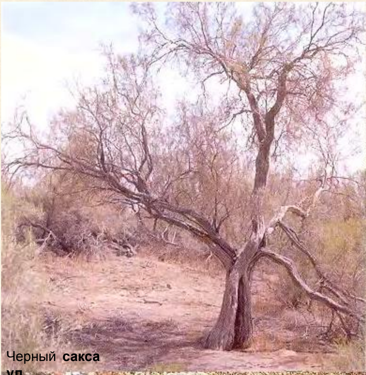
Черный сакса ул