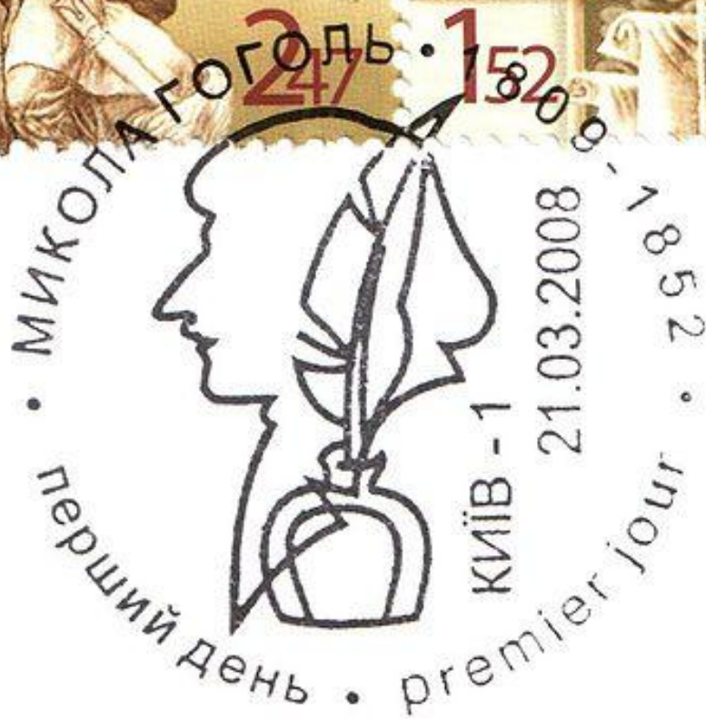
Украина (2008): почтовые марки (сцепка) и гашение к 200-летию со дня рождения Н. В. Гоголя (Михель #949—950). На левой марке — «Тарас Бульба»