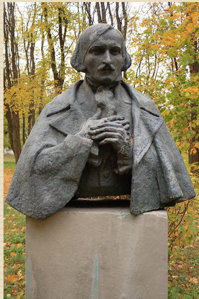
Памятник Гоголю в городе Яготин