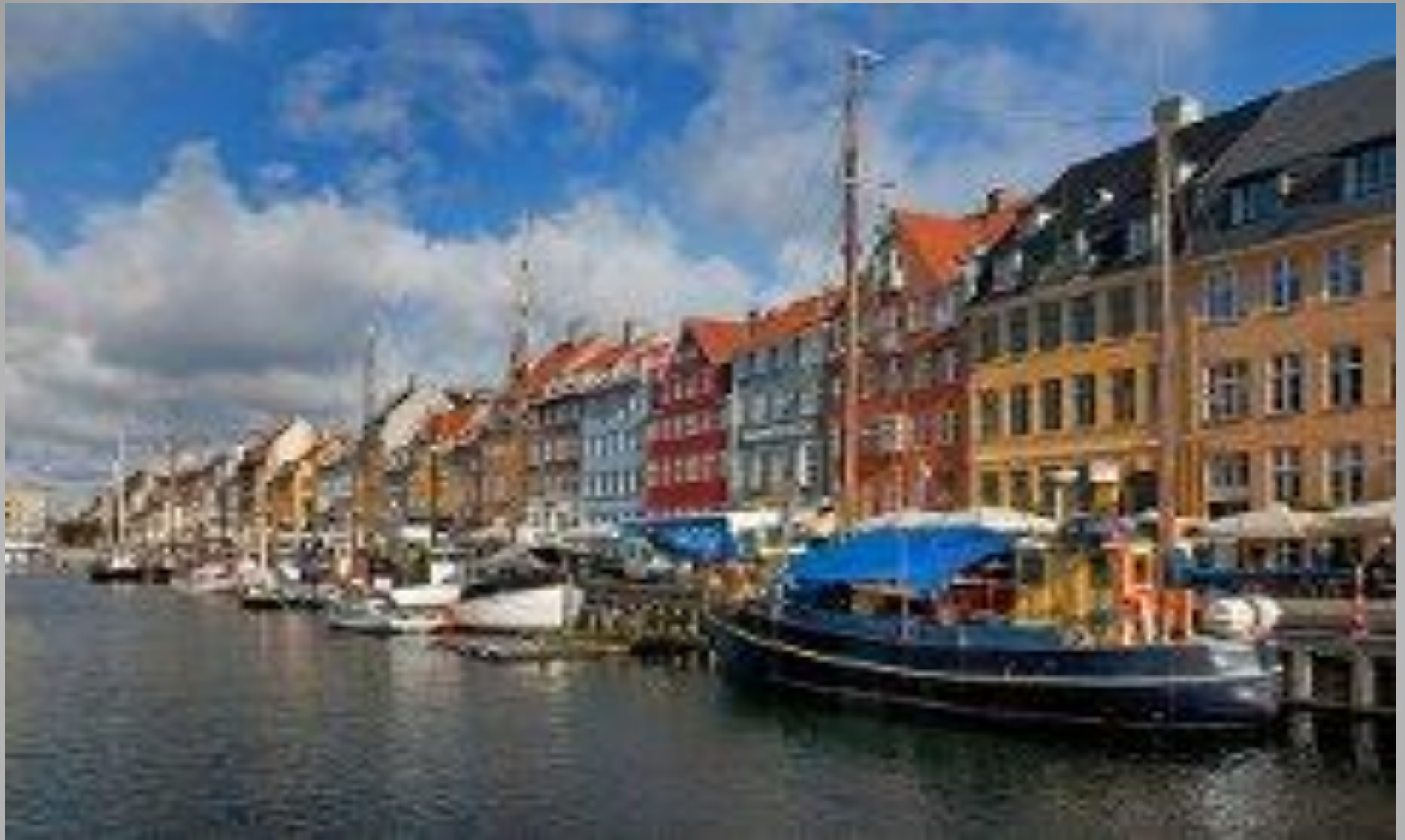
Город Оденс на острове Фюн