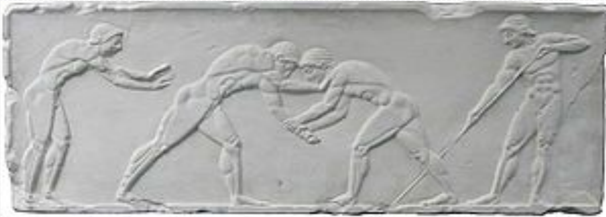
Борьба. Античный барельеф.