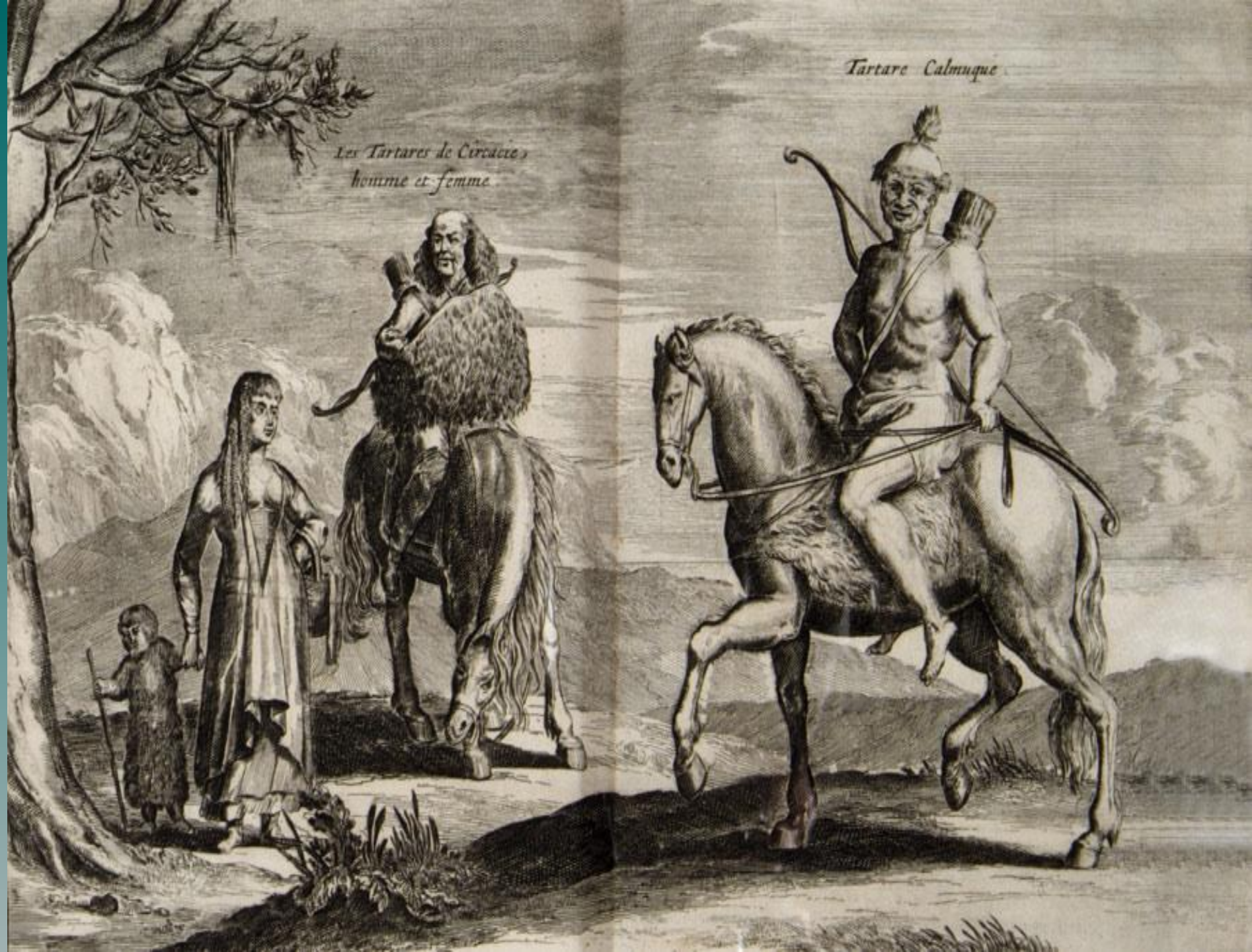
Les Tartares de Circasie homme et femme