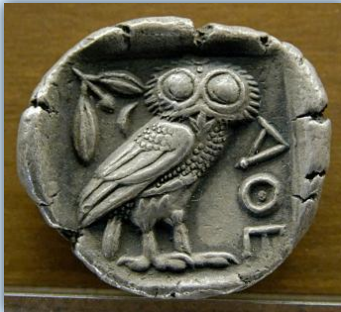
Афины V век до н.