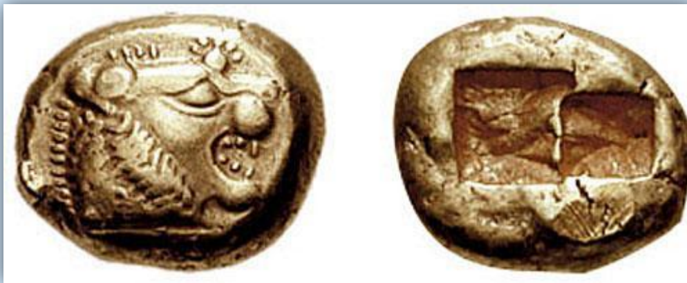
Лидийская монета VI век до нашей эры.