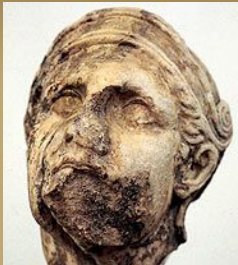
Голова раненого воина.

Деталь рельефа из Галикарнасского Мавзолея.