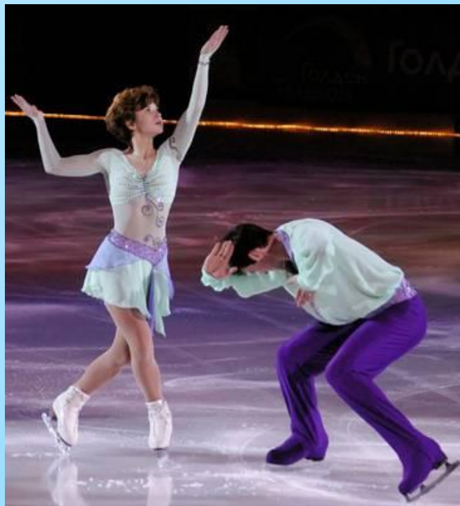
Спортивные танцы на льду

Вид спорта, в котором спортсмены перемещаются на коньках по льду с выполнением дополнительных элементов, чаще всего под музыку. Как правило, разыгрываются четыре комплекта медалей: в женском одиночном катании, в мужском одиночном катании, в парном катании, а также в спортивных танцах на льду.