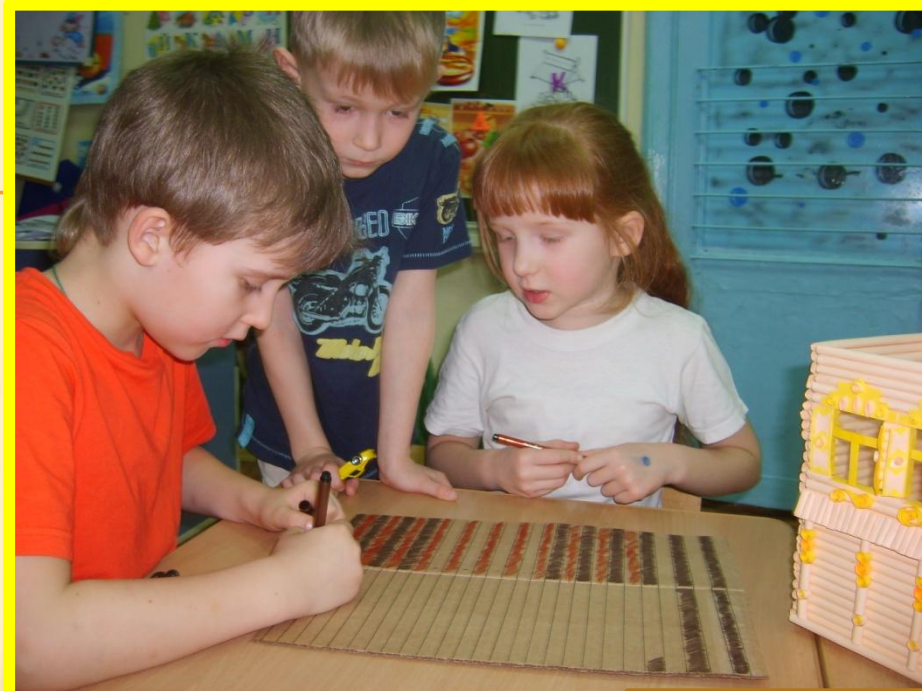
В детском саду