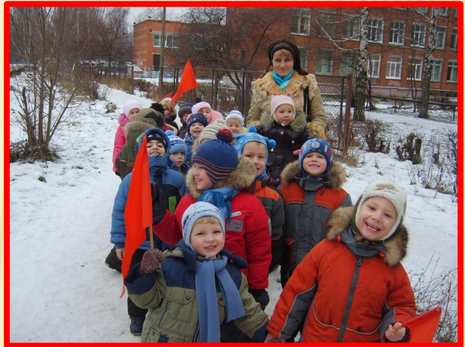
Прогулка «По улицам Нижнего»