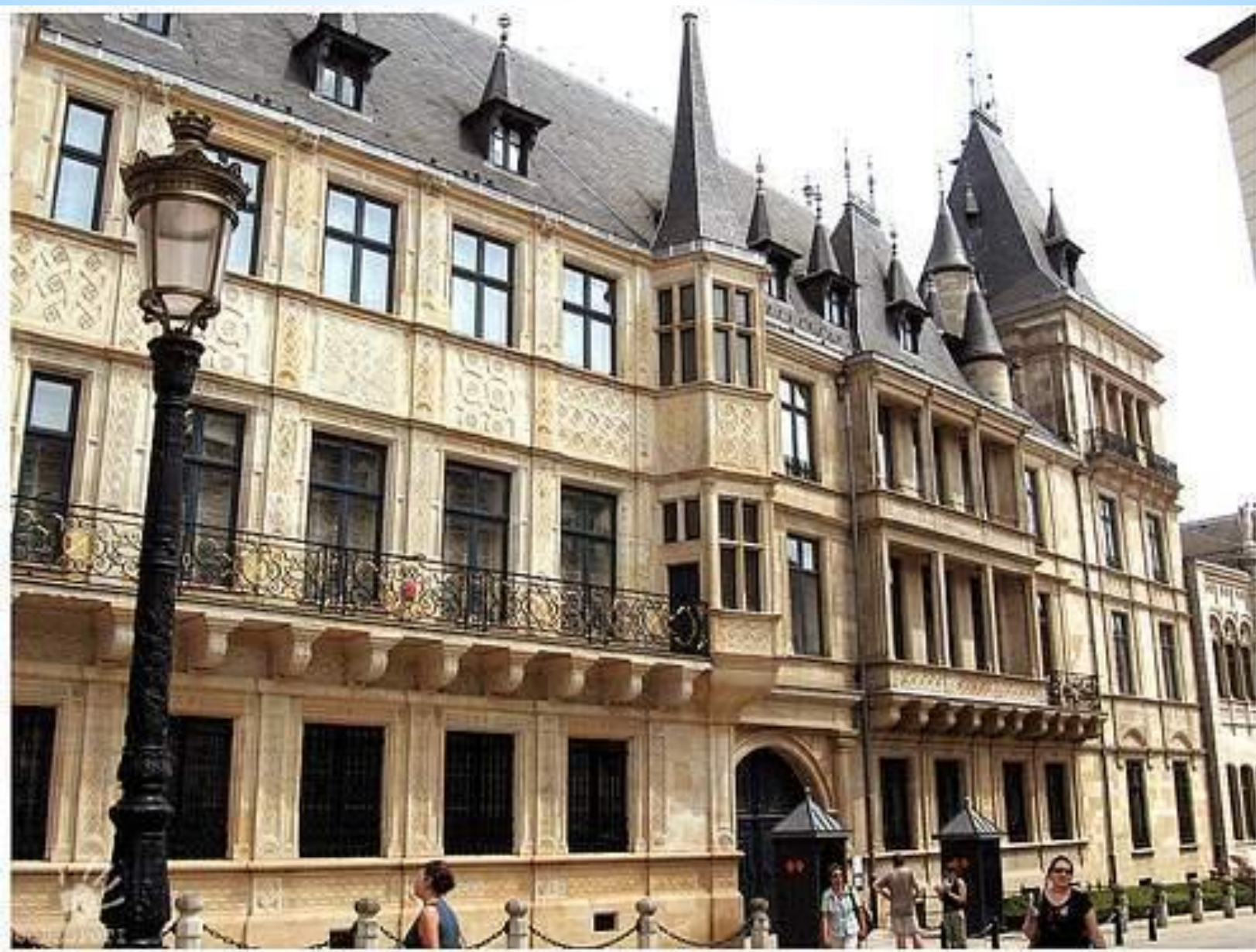
Большой герцогский дворец