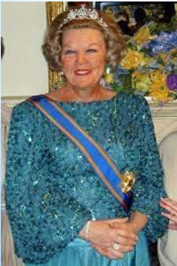
Глава государства-королева Беатрис