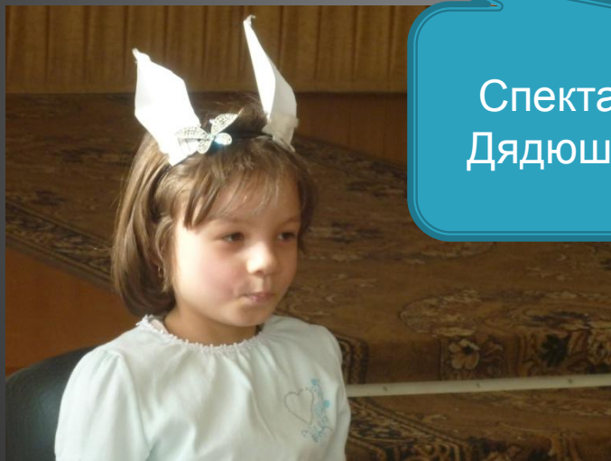
Спектакль «Сказки Дядюшки Риммуса»