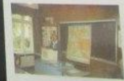
Знакомство с залом ветеранов Б.О.С. Нелма Н.И.