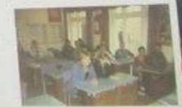
Участие Ф.К. в 11 мая 2005