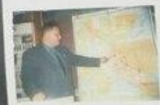
Заслушает Виктор История Сербских Б.С.