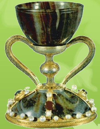
Чаша из собора в Валенсии. Верхняя часть, возможно, относится к эпохе эллинизма.