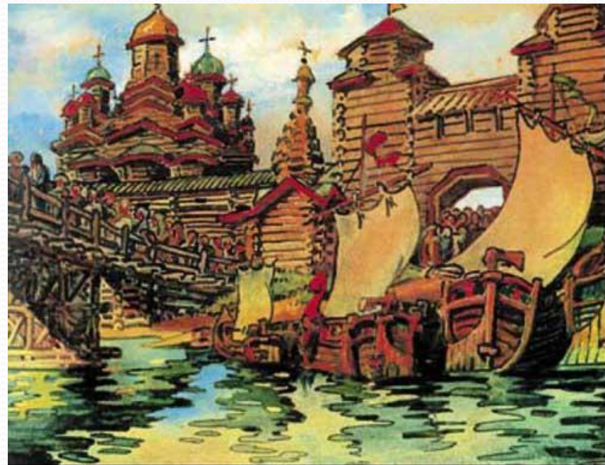
Великий мост и Св. София Новгородская. Реконструкция Д.П. Сухова