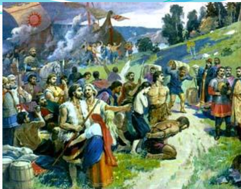
Славяне делят рабов и другую добычу, вернувшись из дальнего похода