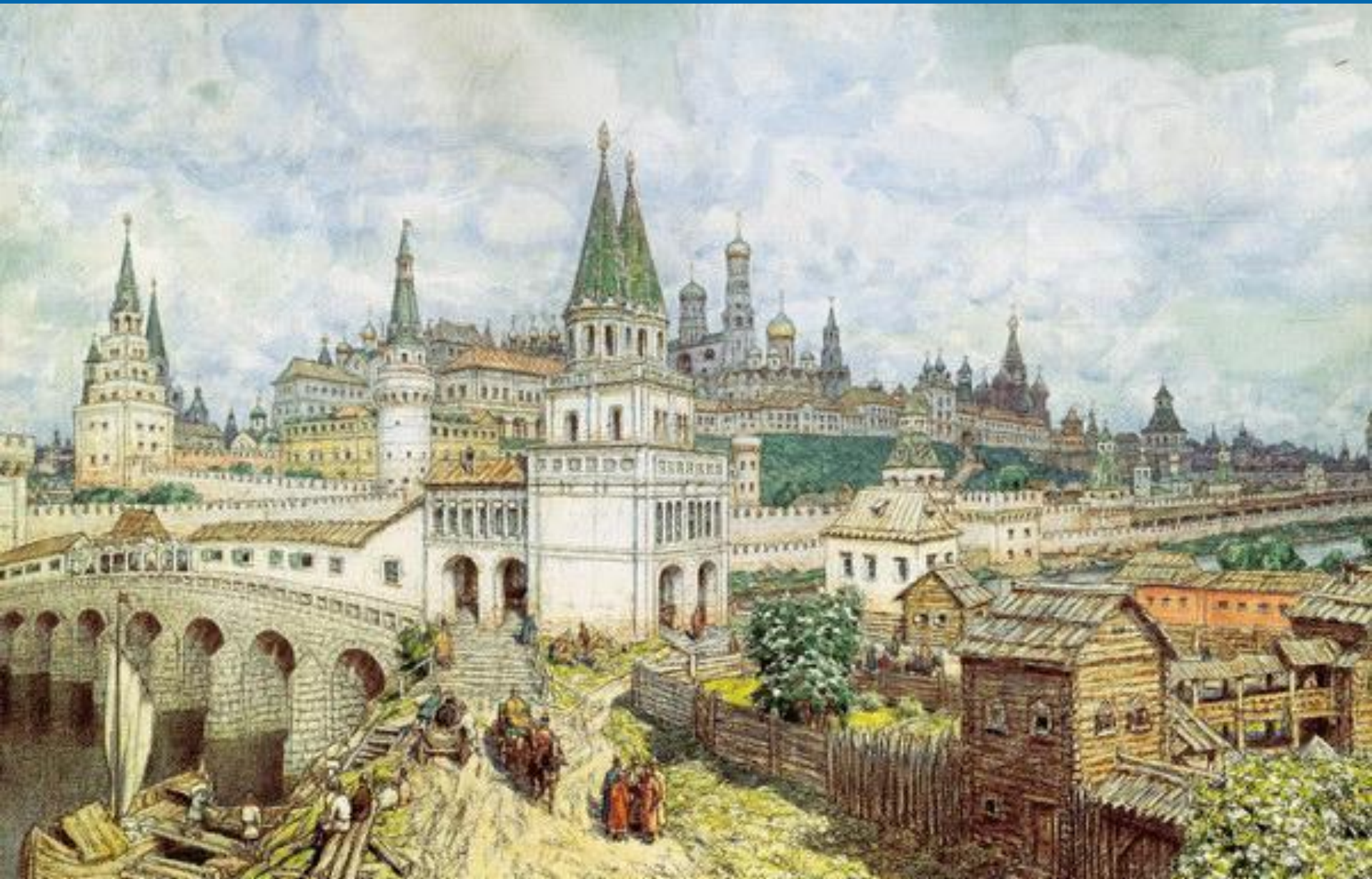
Московский Кремль XVI — XVII вв.