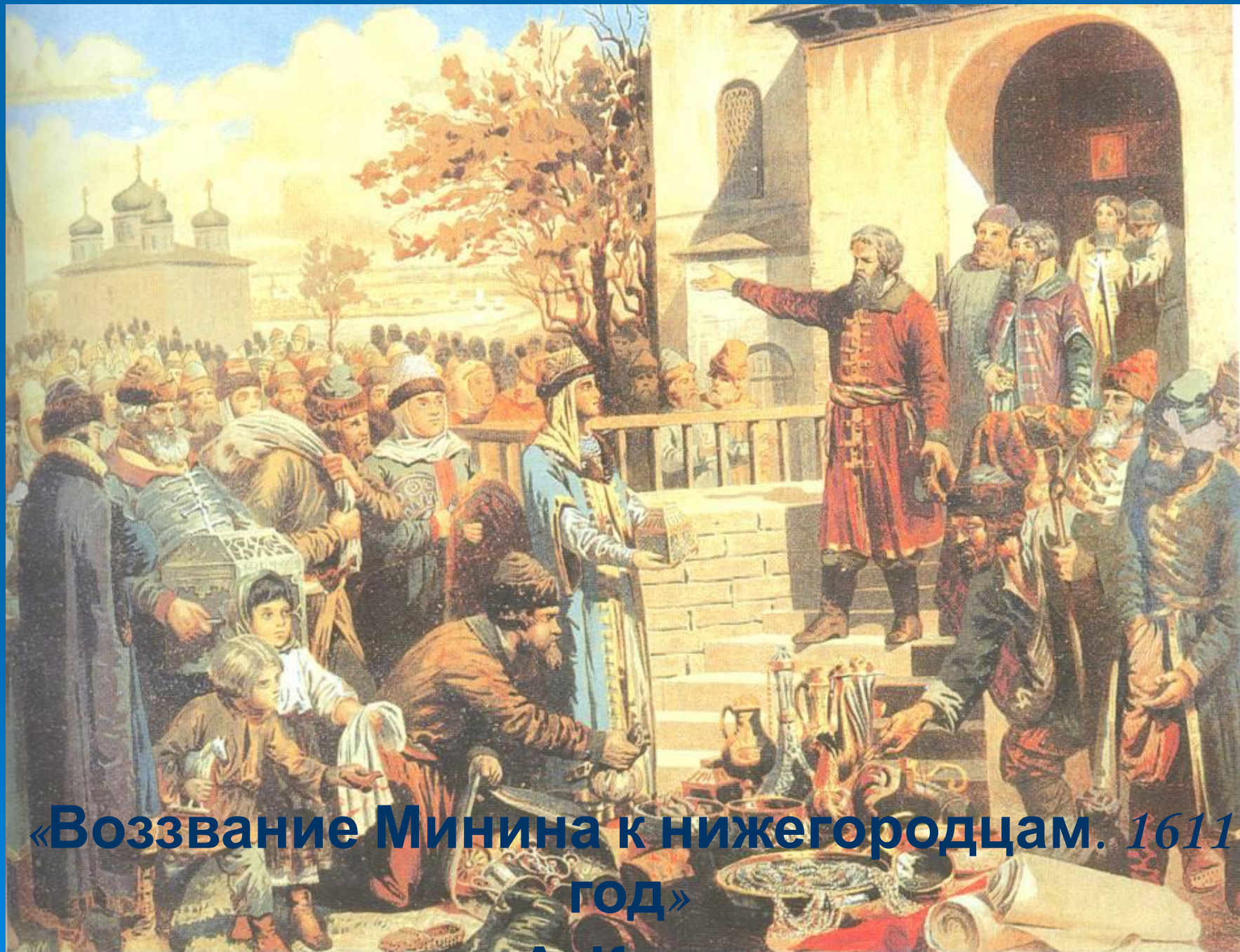
«Воззвание Минина к нижегородцам. 1611 год»