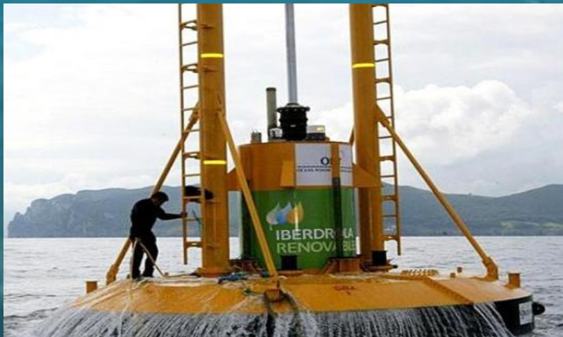
Америка, штат Орегон

Однако уже инженерно разработаны и экспериментально опробованы высокоэкономичные волновые энергоустановки, способные эффективно работать даже при слабом волнении или вообще при полном штиле. Такие можно наблюдать, к примеру, в Америке и Испании.