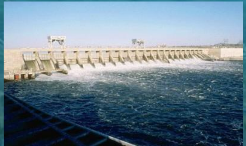
Испания, г. Сан-Себастьян, Поселок Мутрику