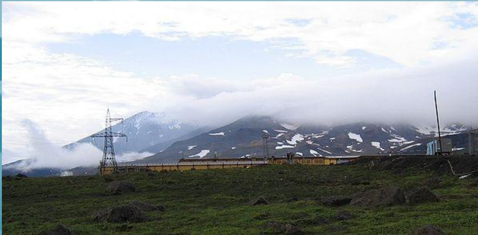
Мутновская геотермальная электростанция, Камчатка

Подземное тепло планеты – довольно хорошо известный и уже применяемый источник “чистой” энергии. В России первая геотЭС мощностью 5 МВт была построена в 1966 г. на юге Камчатки, в долине реки Паужетки. В 1980 г. ее мощность составляла уже 11 МВт.