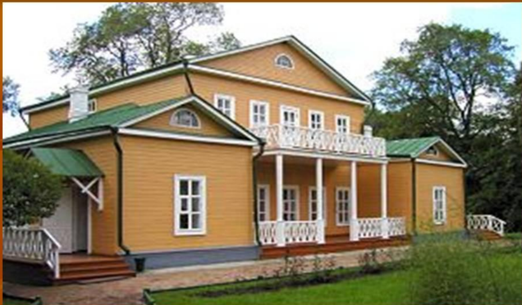
Дом-музей М.Ю.Лермонтова в Тарханах.