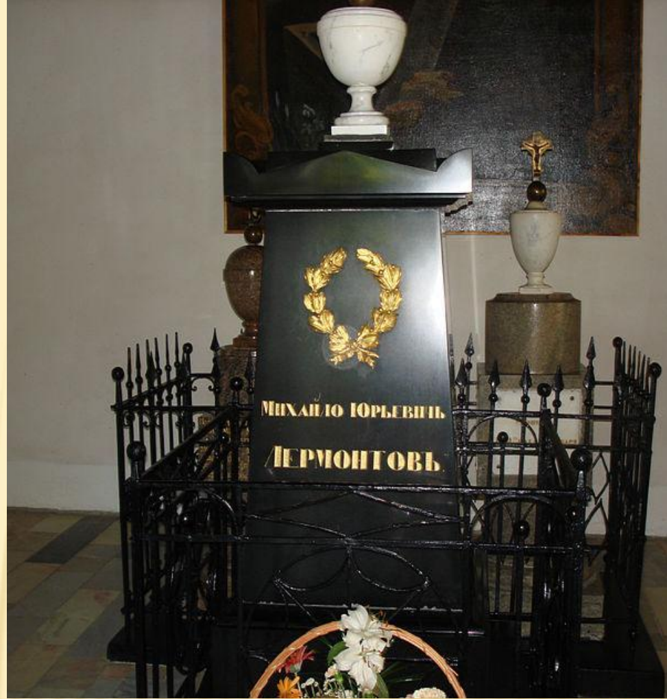
Надгробие М.Ю. Лермонтова. Семейная усыпальница, село Тарханы.