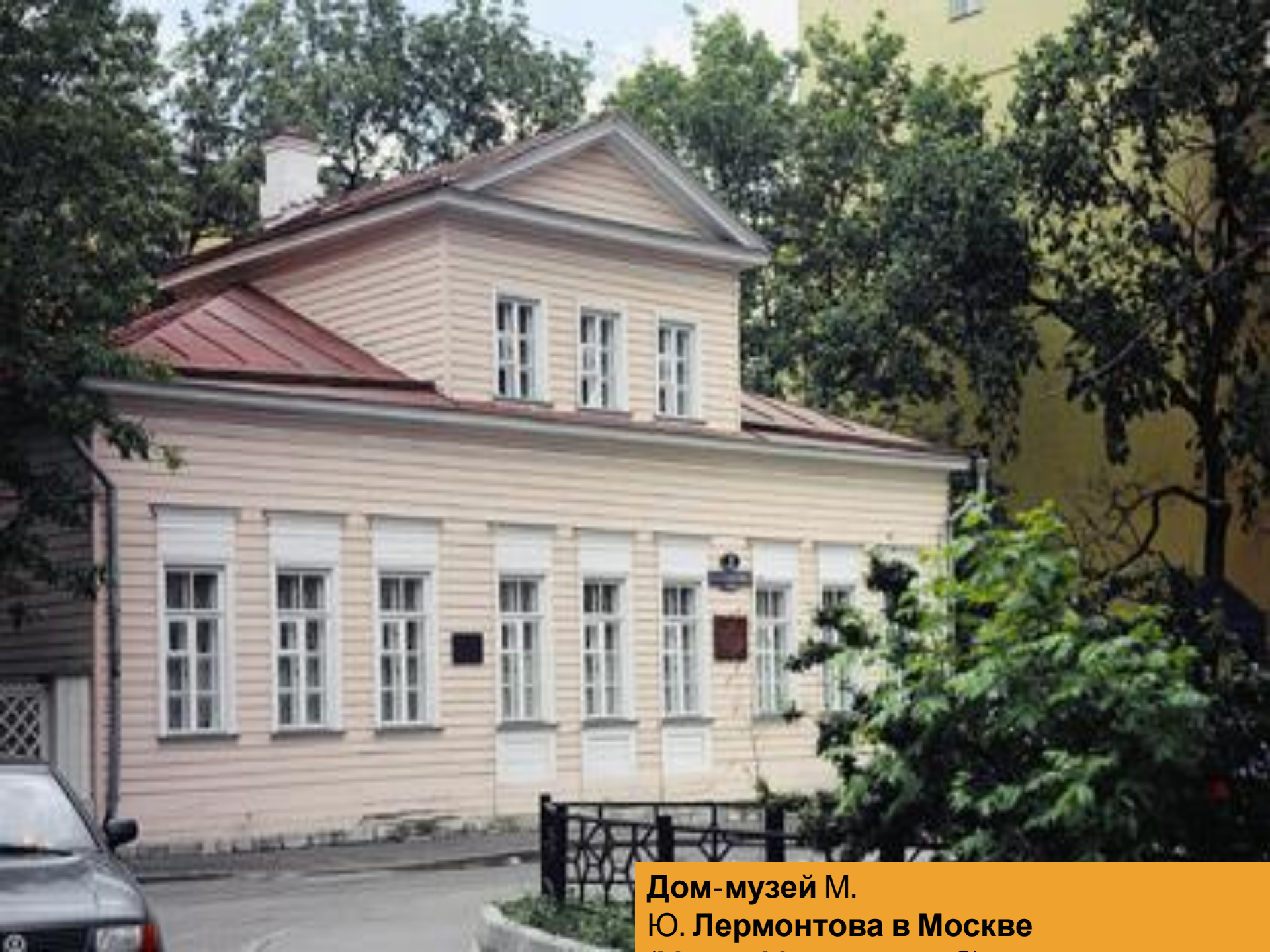
Дом-музей М. Ю. Лермонтова в Москве