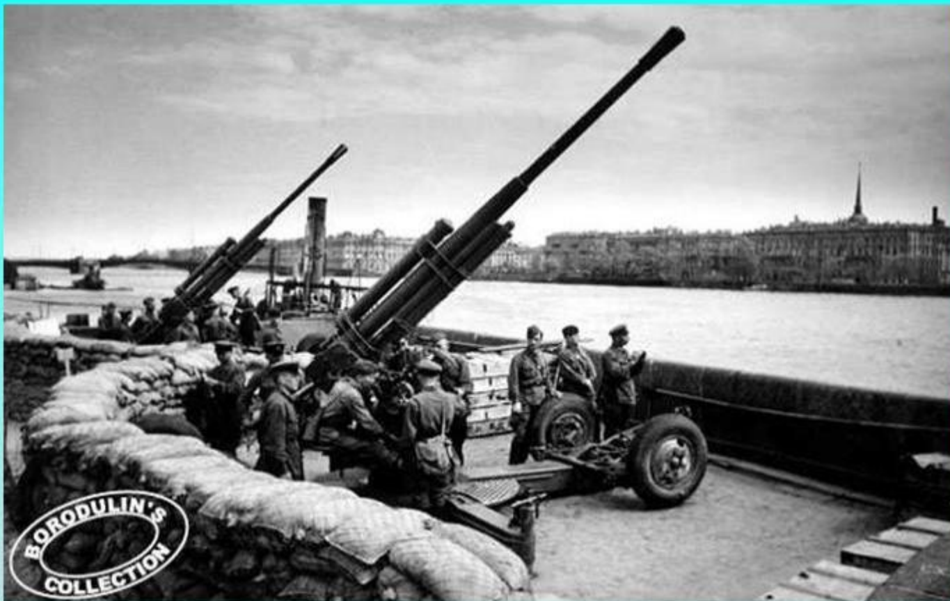
На берегу Невы.

В ТЕЧЕНИЕ 1942 ГОДА БЫЛИ ПРЕДПРИНЯТО ПЯТЬ ПОПЫТОК ПРОРЫВА БЛОКАДЫ, НО ВСЕ ОНИ ОКАЗАЛИСЬ НЕУДАЧНЫМИ.