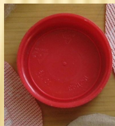
Крышка от молочной бутылки