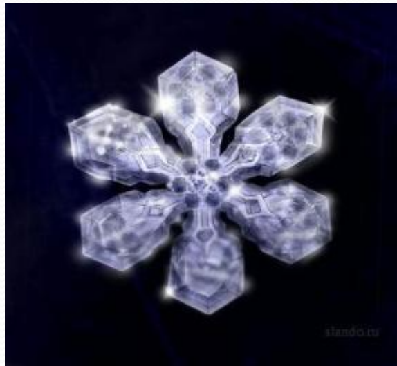
Кристалл древнего антарктического льда

Кристалл родниковой воды и кристаллы древнего антарктического льда имеют правильную форму