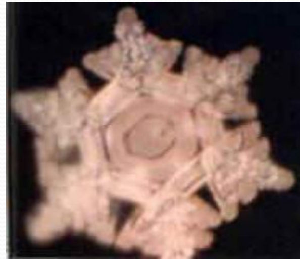
Кристалл родниковой воды