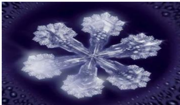
Кристалл живой воды

По данным изобретателей “живая вода” является раствором с усиленными электронодонорными свойствами и, попадая в кровь человека, усиливает её электронодонорный фон на несколько десятков милливольт. Авторы приводят сведения о механизмах действия «живой воды»: ускорение процессов синтеза ДНК; усиление функции печени; нормализация энергетического потенциала клеток; повышение энергообеспечения клеток.