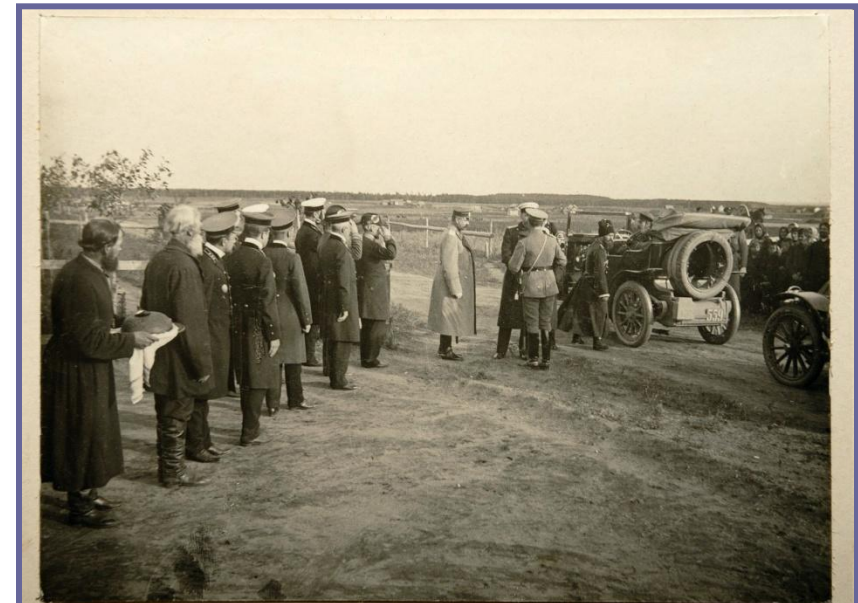
Приезд П. А. Столыпина на хутора близъ Москвы, въ Августѣ 1910 г.