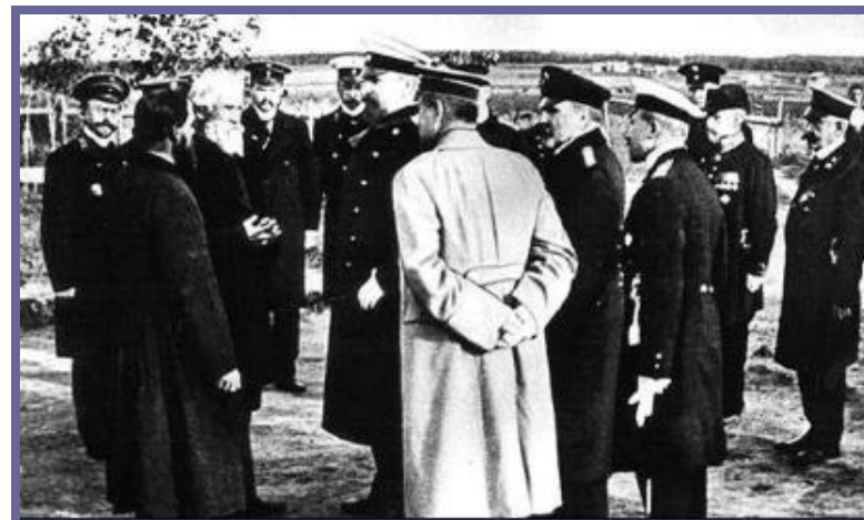
П.Столыпин в гостях у кулака.

В результате удалось не только вывести сельское хозяйство из кризиса, но и превратить его в доминанту экономического развития России. Россия была крупнейшим производителем и экспортером хлеба и льна, ряда продуктов животноводства. Так, в 1910 году экспорт российской пшеницы составил 36,4% общего мирового экспорта. Неслучайно эти результаты иностранцы называли «русским чудом».