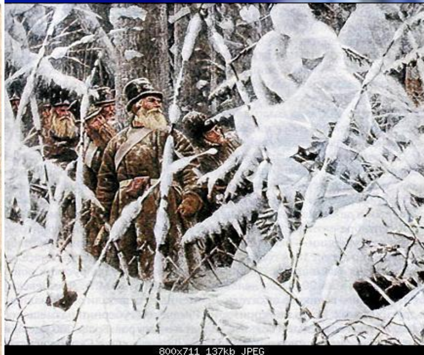
800x711 137kb JPEG