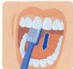
3. Внутренние поверхности передних зубов