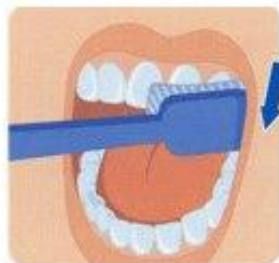
1. Наружные поверхности зубов