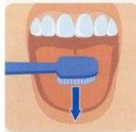
6. Чистка языка