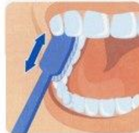
4. Жевательная поверхность зубов