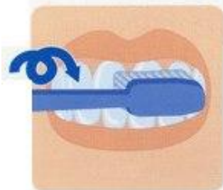
5. Массаж десен