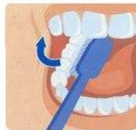
2. Внутренние поверхности зубов