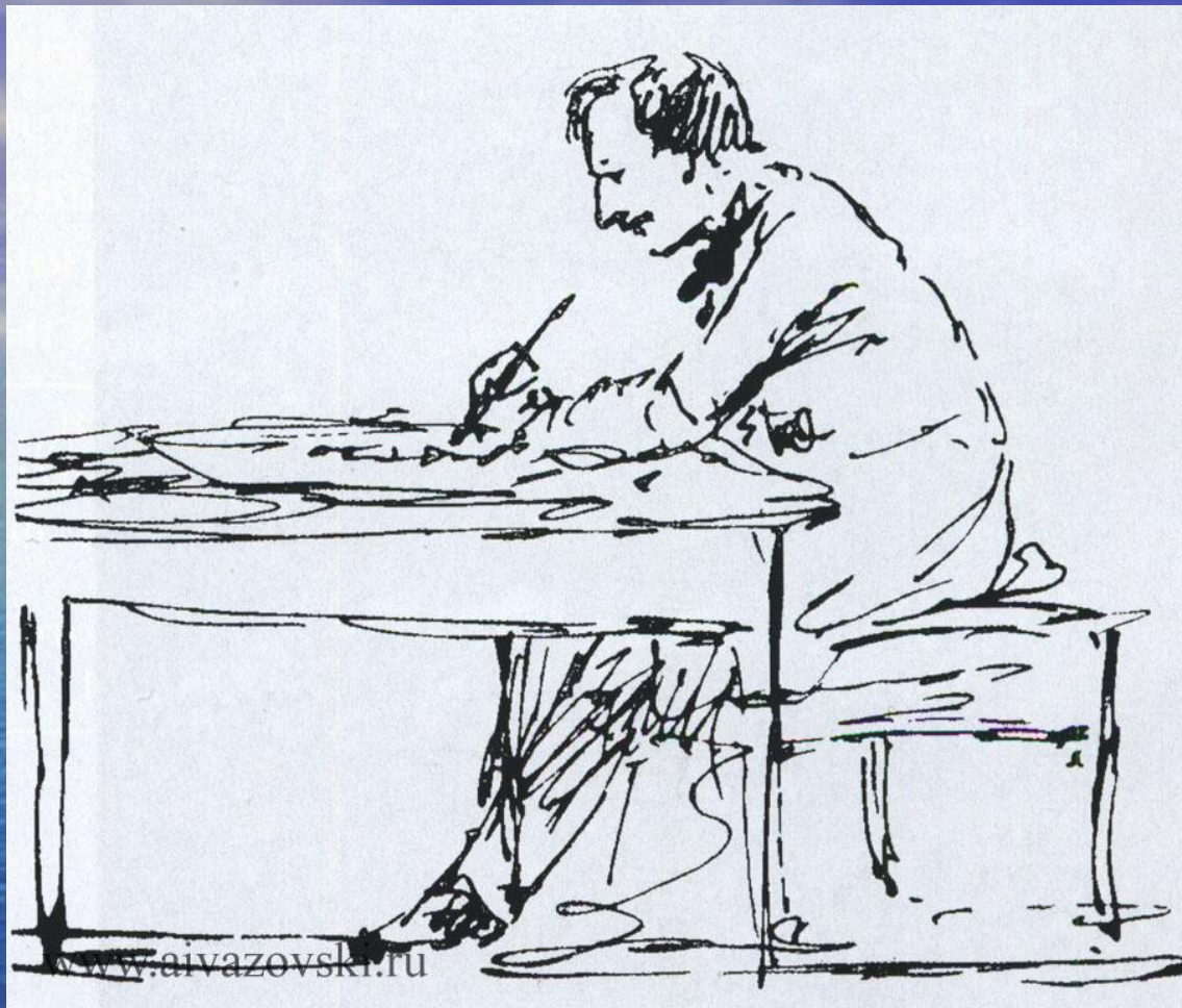
И.К. Айвазовский за письменным столом. Автопортрет. 1880