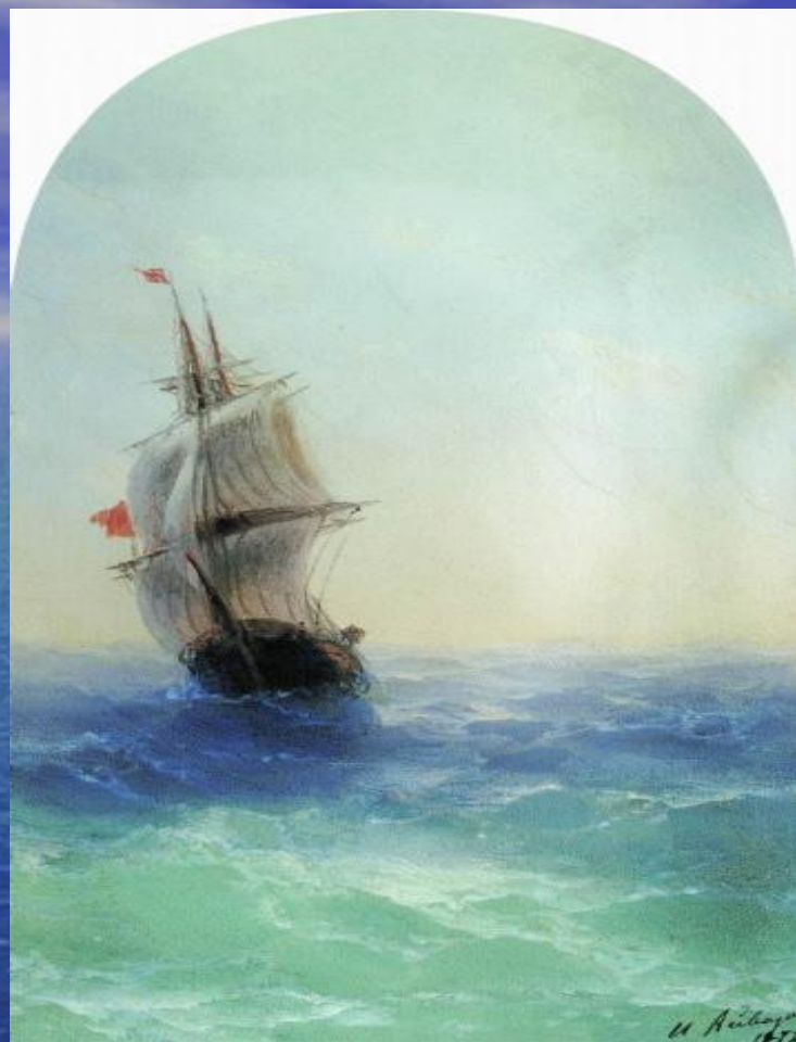
Бушующее море 1872