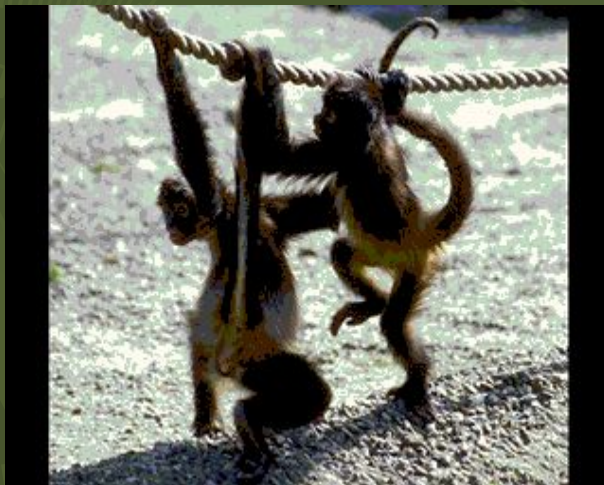
Коаты – цепкохвостые обезьяны