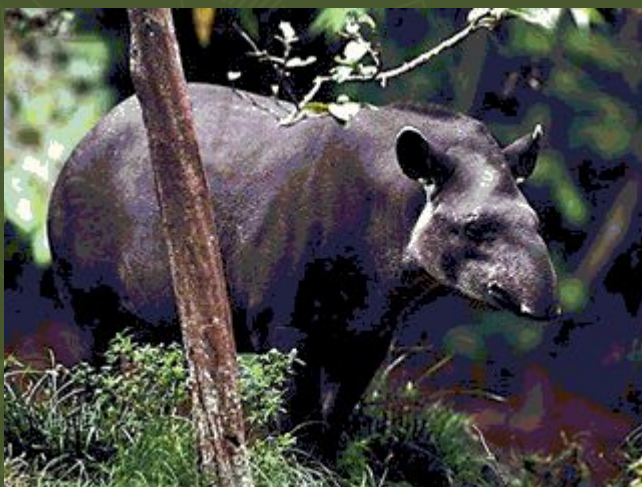
Равнинный тапир – непарнокопытное животное