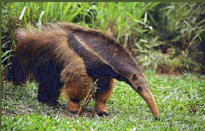
Гигантский муравьед – млекопитающее из семейства неполнозубых