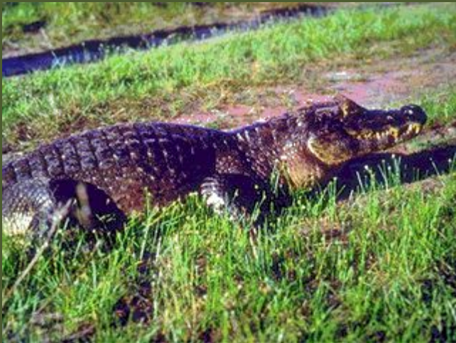
Широкомордый кайман достигает в длину 3.5м, от крокодилов отличается строением челюстей