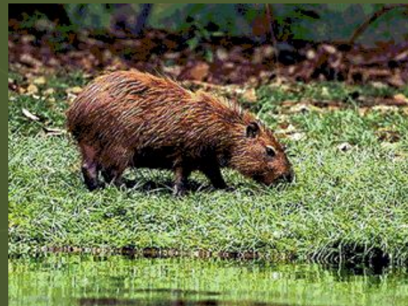
Капибара – самый крупный современный грызун (длина тела до 1.3 м)