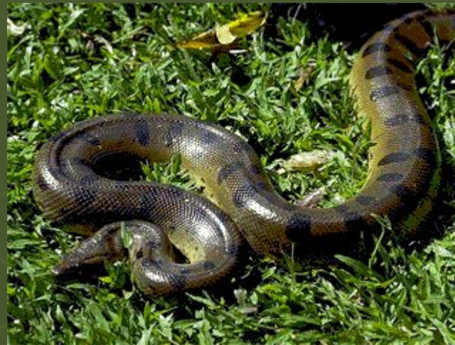
Анаконда или водяной удав