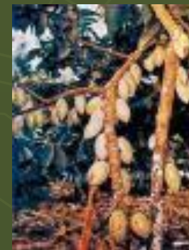
сейба Шоколадное дерево