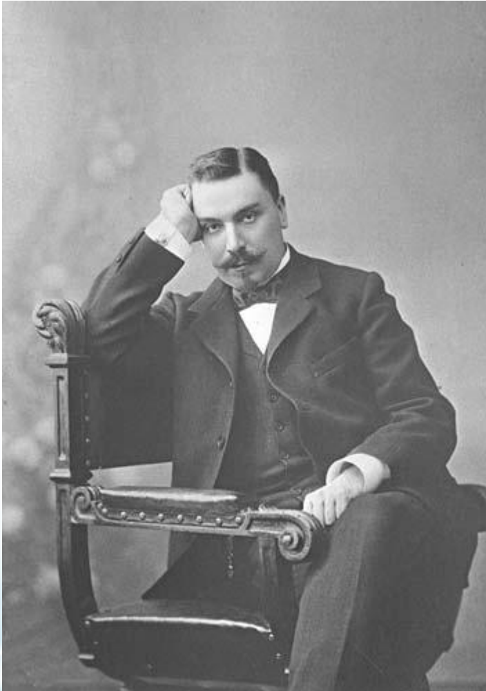
Александр Иванович Баранов