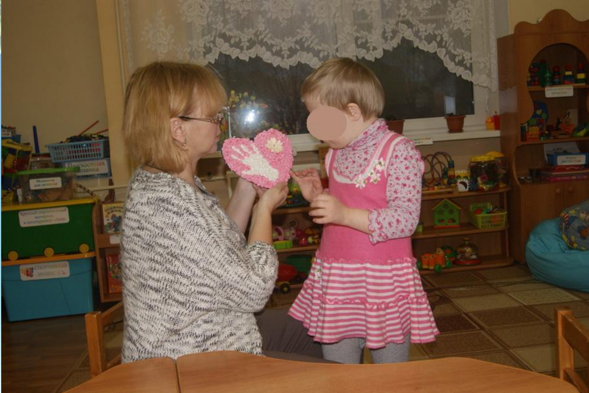
Ева любит полученным результатом