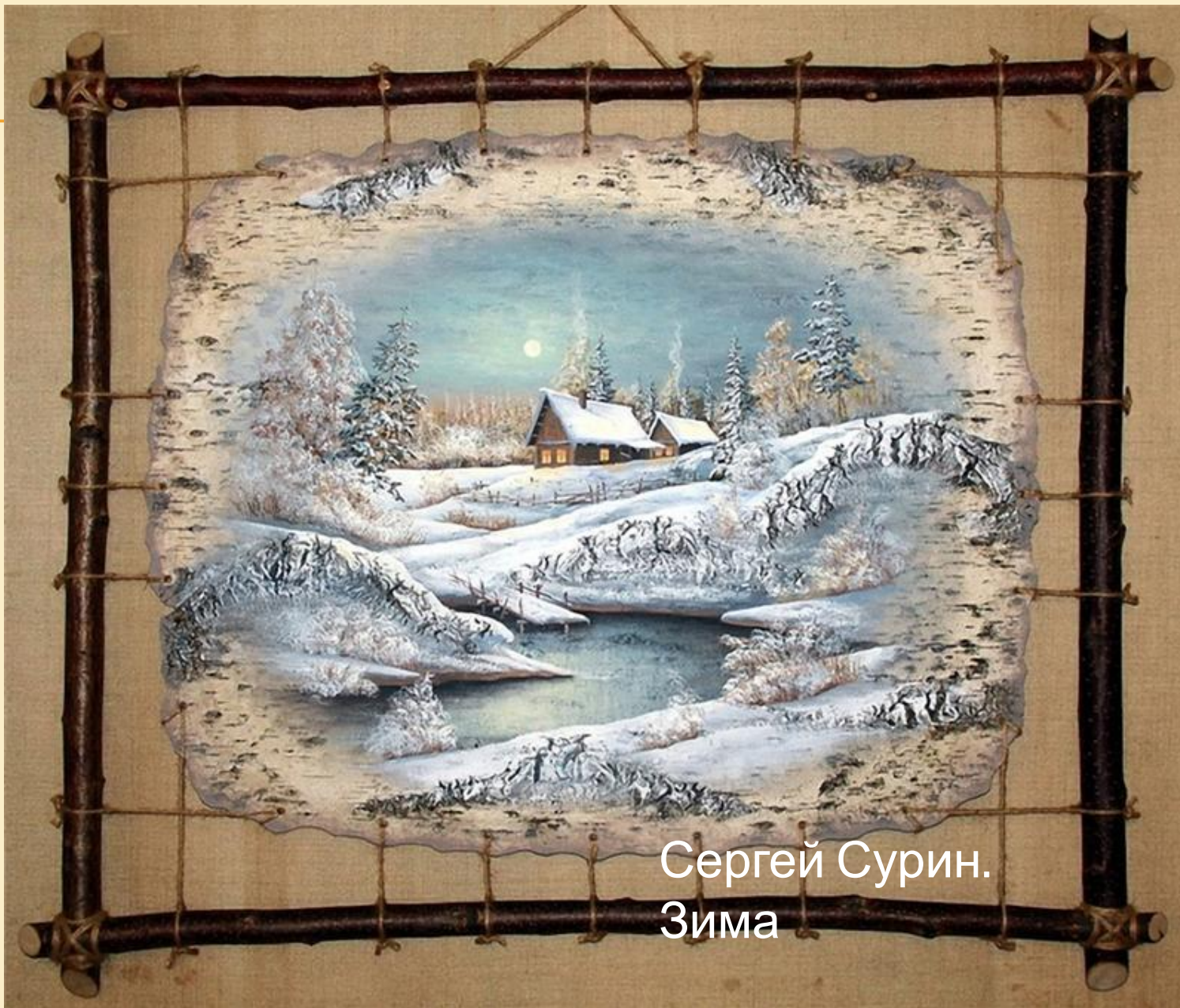
Сергей Сурин. Зима