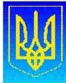
Герб Украины Президент Украины