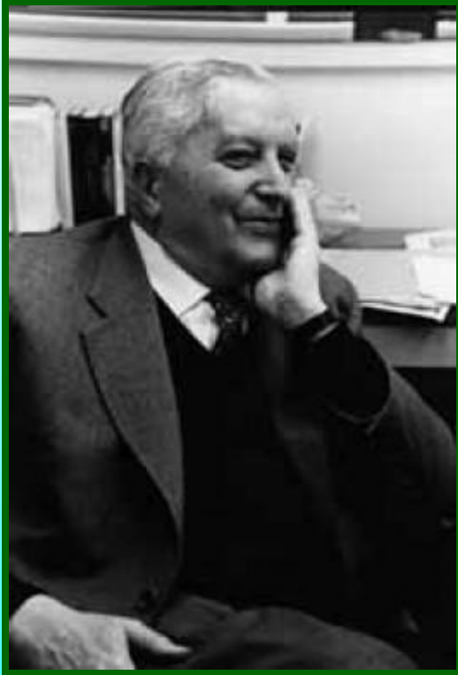
И. Р. Пригожин

Во второй половине 20 века обозначилась тенденция к сближению друг с другом не только разных общественных наук, но и их всех с естественными и точными науками. Эта тенденция отразилась, прежде всего, в формировании и росте популярности основанной И.Пригожиным синергетики – науки о наиболее общих закономерностях развития и самоорганизации сложных систем (включая и общество). Тем самым на новом витке развития науки происходит как бы возвращение к представлениям древних о едином «космосе».