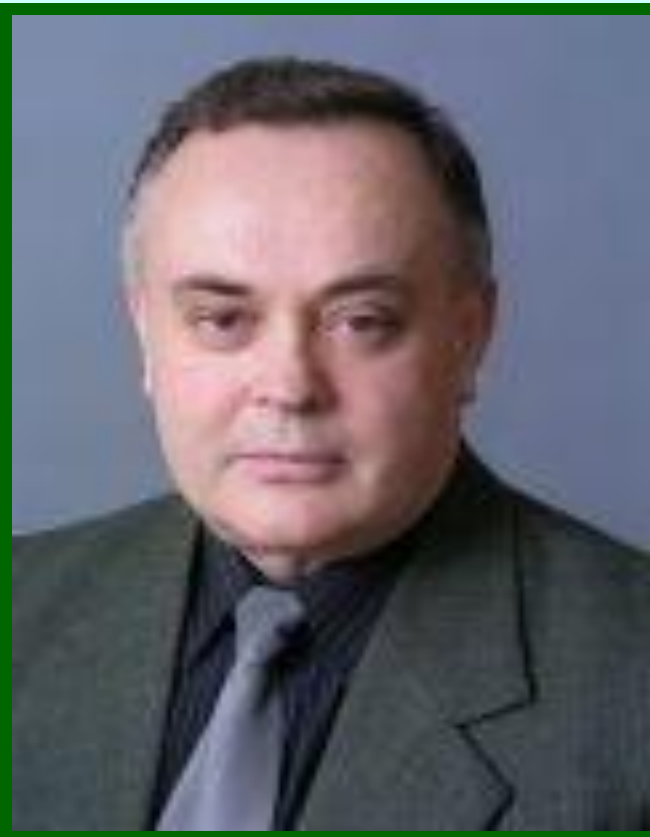
А. Н. Костенко

В настоящее время актуализируется проблема преодоления разрыва между так называемыми «естественными науками» и «социальными (гуманитарными) науками», который трактуется как нарушение принципа природной целостности мира. Украинский ученый А.Н.Костенко сформулировал принцип социального натурализма. Социум, исходя из этого принципа, - это тоже природа, но природа отличная от физической и биологической природы - так называемая «третья природа», существующая по своим природным законам (так называемая "теория трех природ"). На основании принципа социального натурализма все науки, в том числе и социальные (гуманитарные) науки признаются равным образом естественными науками.