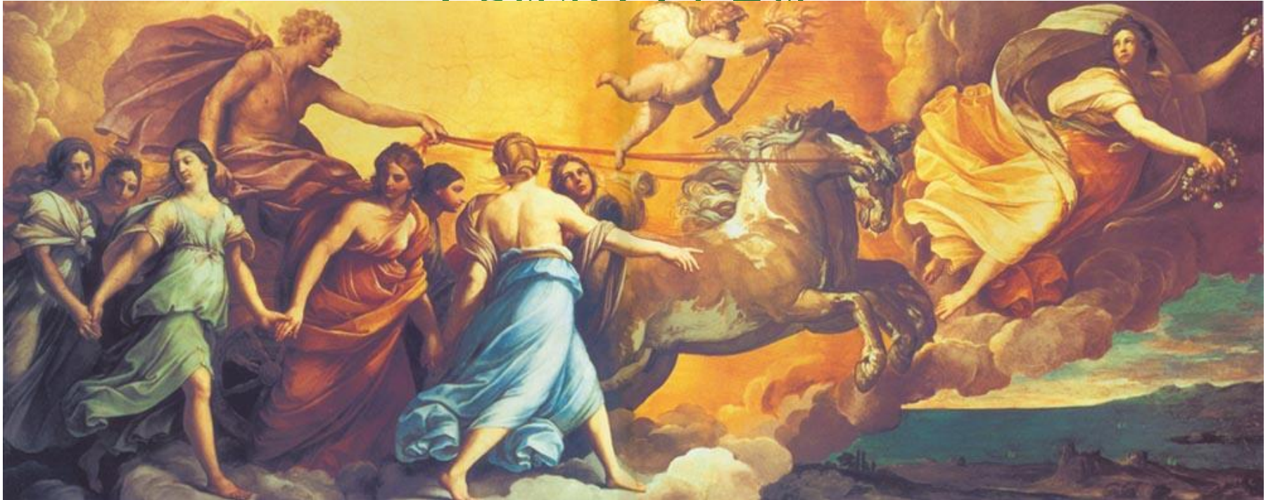
Аврора (1614). Палаццо Роспильози-Паллавичини, Рим