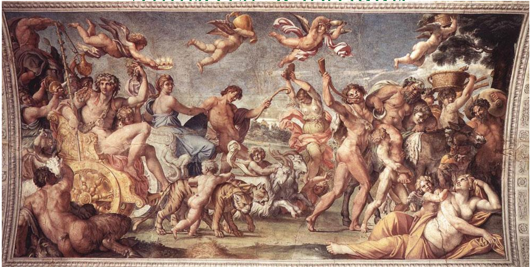
Триумф Вакха и Ариадны 1597-1602 гг.