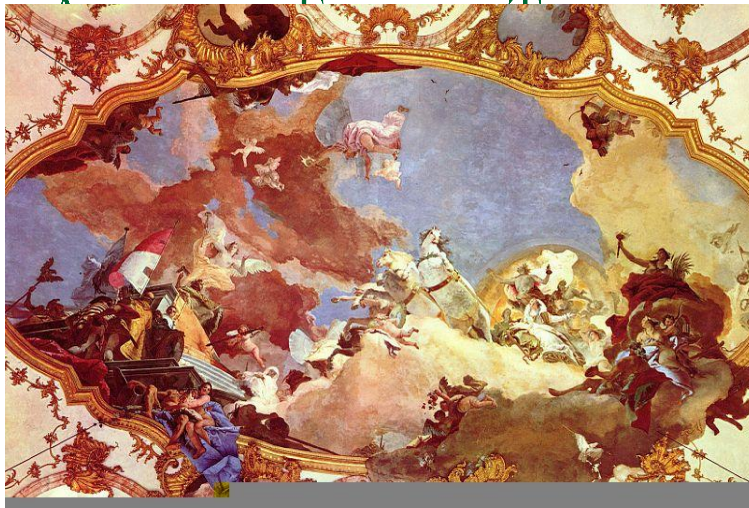
Фреска Вюрцбургской резиденции