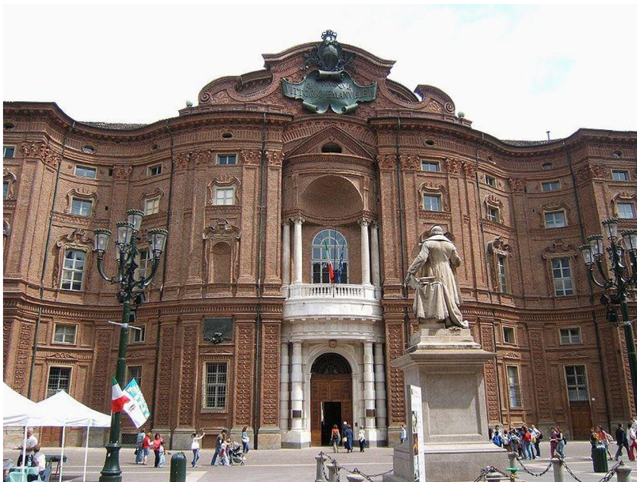
Вогнуто-выпуклый фасад палаццо Кариньяно в Турине.