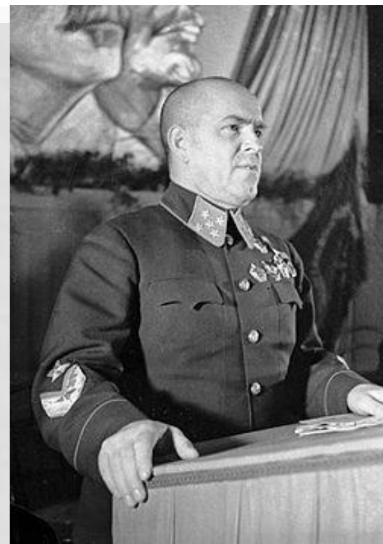
ГЕОРГИЙ КОНСТАНТИНОВИЧ ЖУКОВ