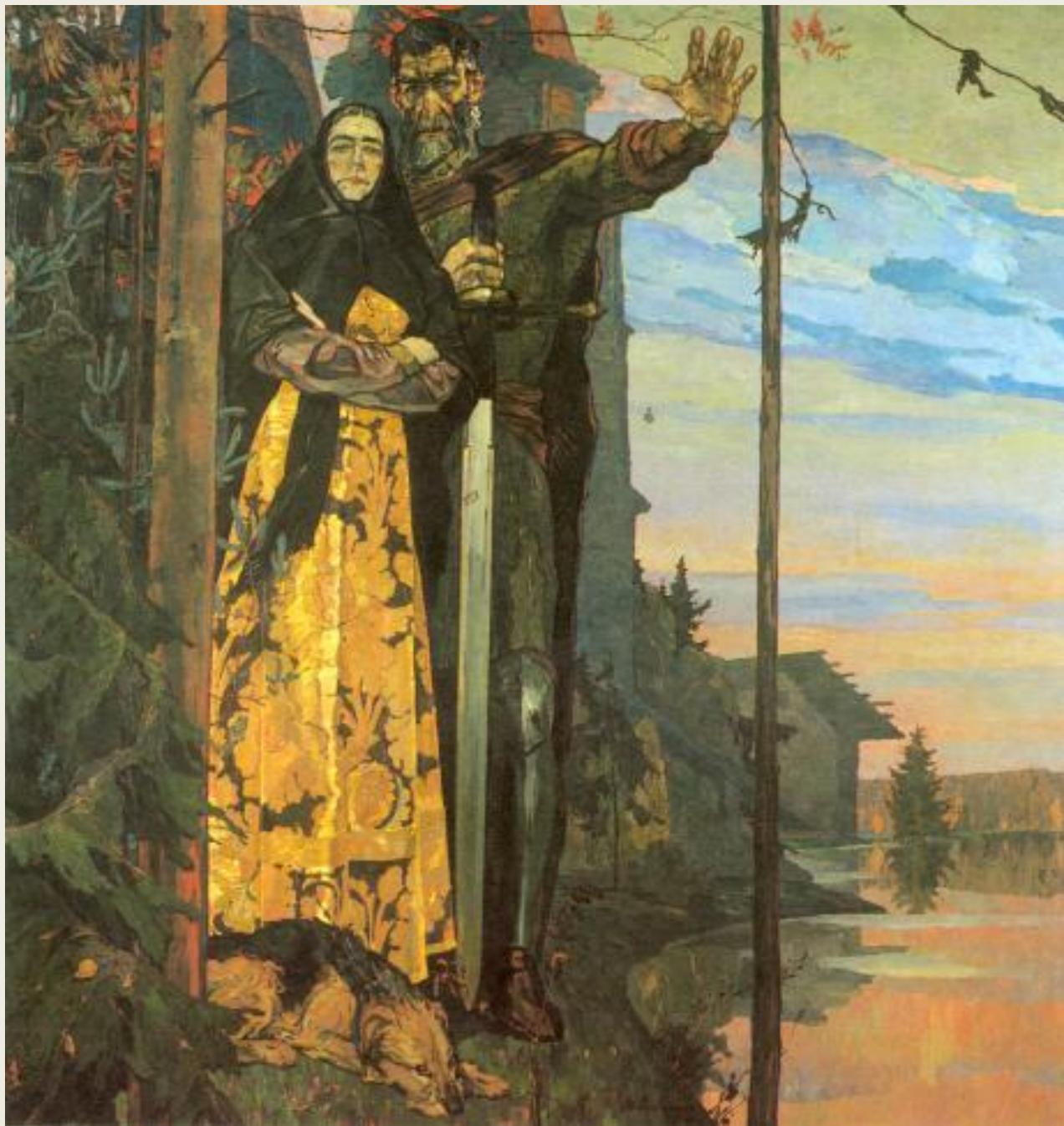
А . Корин «Александр Невский».