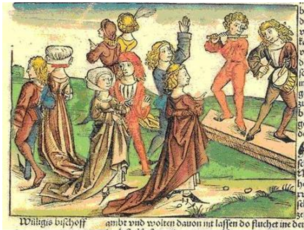
Иллюстрация из книги. 1494 г.

Дьявол, а танцующие, таким образом, становятся слугами дьявола.