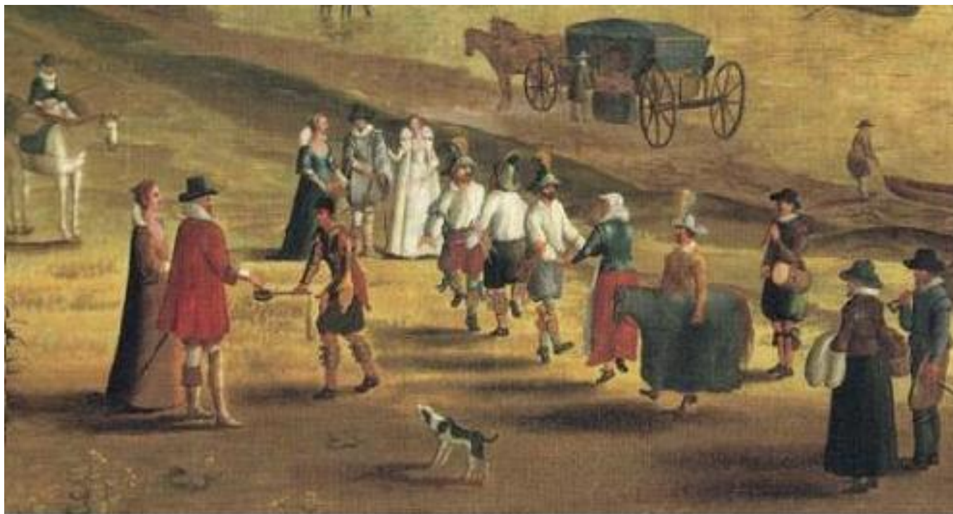
Танцовщики морески (фрагм. картины "The Thames at Richmond", 1620 г.)

Пантомимический средневековый танец, исполняющийся в гротескных одеяниях с колокольчиками на щиколотках несколькими танцовщиками под музыкальное сопровождение.