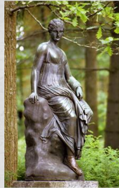
Эвтерпа-муза лирической поэзии