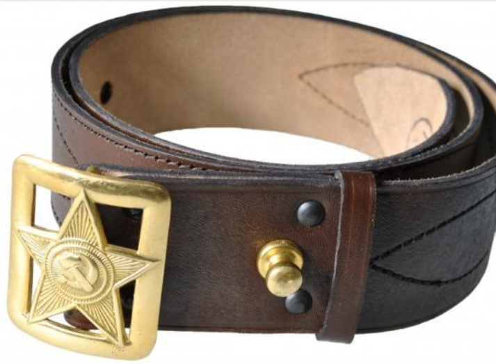
1) Ремень безопаснос ти