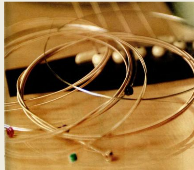
2) Струна спокойствия