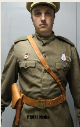
3) Португепя надежности