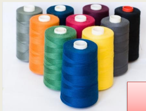
4) Ниточка спасения

10. Как называется устройство автомобиля, которым должен быть пристегнут водитель?