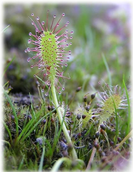
Росянка английская (длиннолистная)