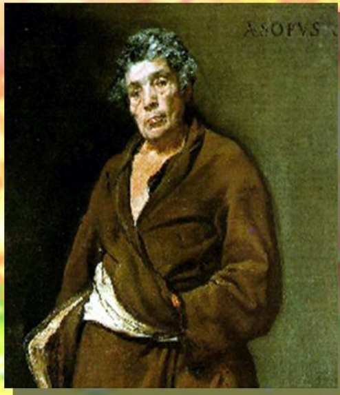
Эзоп. С картины Д.Веласкеса