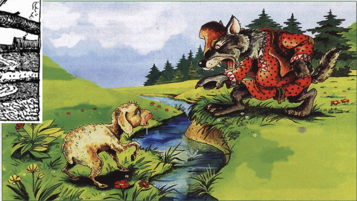
В. Кастальский. Иллюстрация к басне «Волк и Ягненок»