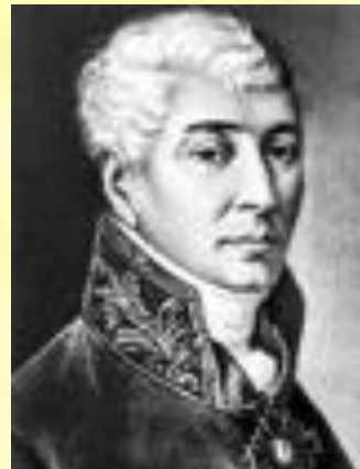
Иван Иванович Дмитриев