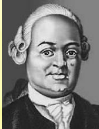
Василий Кириллович Тредиаковский