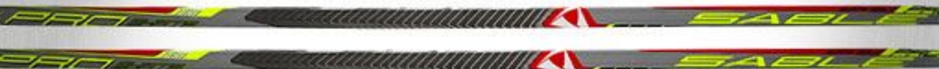
ГОНОЧНЫЕ ЛЫЖИ PRO SKATE & PRO CLASSIC