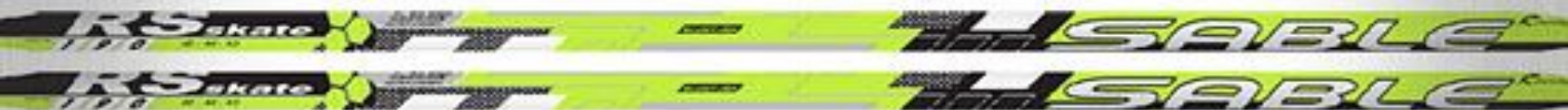
ГОНОЧНЫЕ ЛЫЖИ RS SKATE & RS CLASSIC