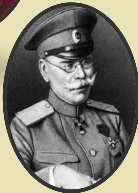
Великий князь Николай Николаевич Верховный Главкомандующий всеми сухопутными и морскими силами Российской Империи в начале Первой мировой войны (1914—1915)