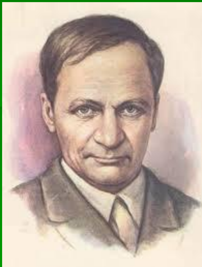
Андрей Платонович Платонов - Климентов (1899-1951 г.г.)