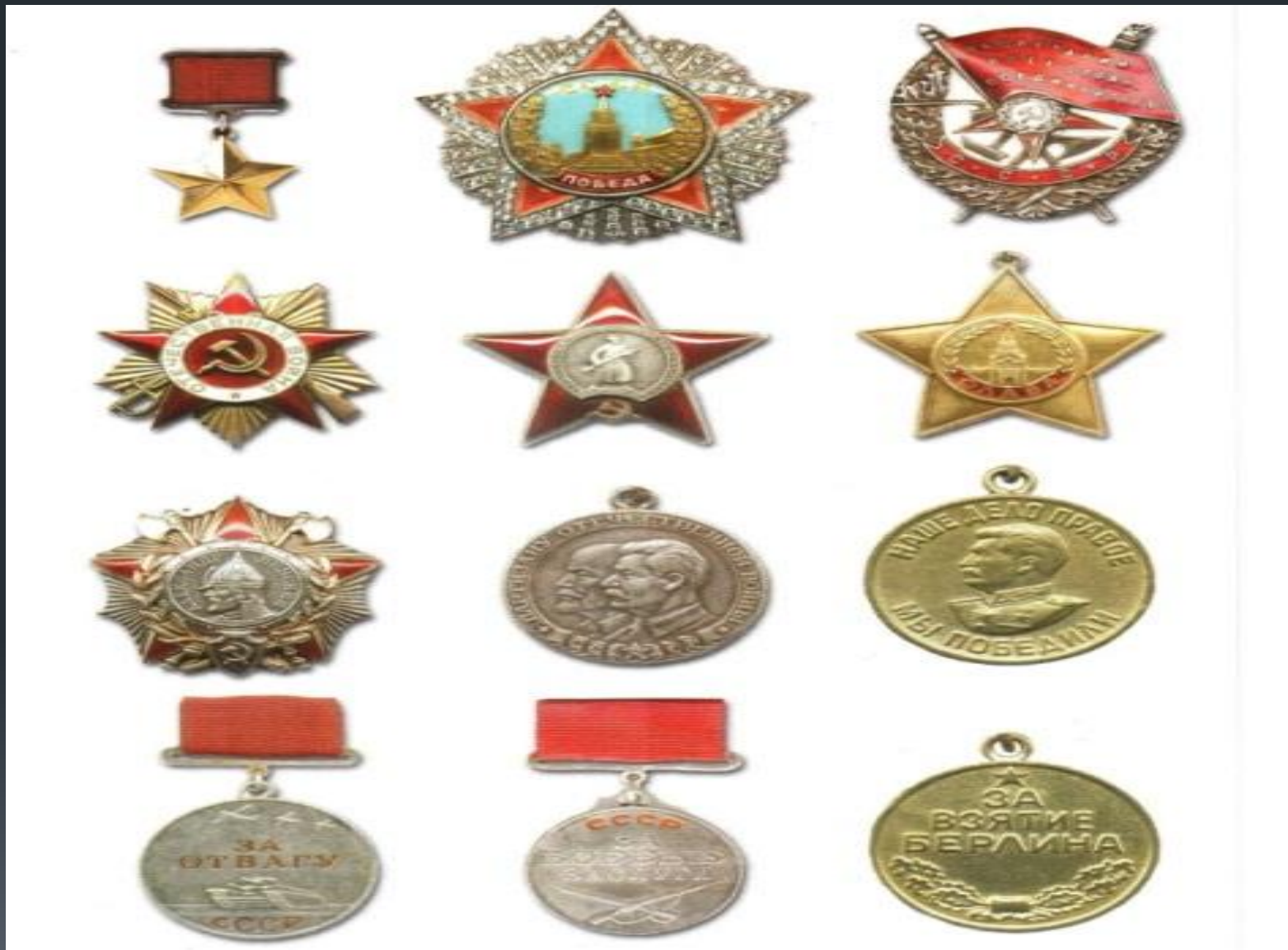
«Ордена и медали»