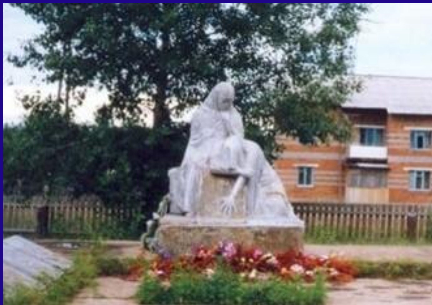
«Скорбящая женщина – мать» п. Новоилимск