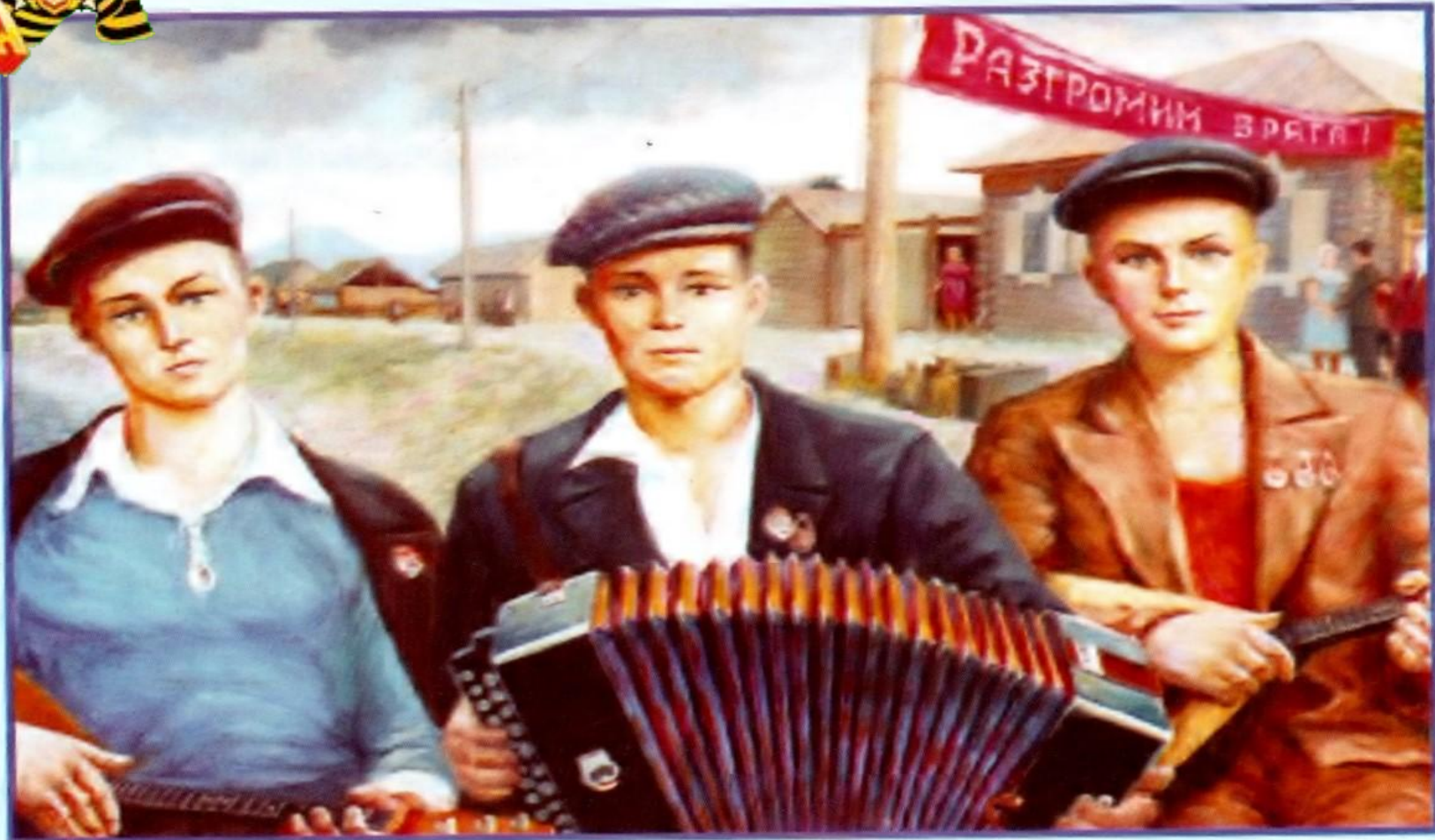
ПРОВОДЫ НА ФРОНТ. С картины худ. Г.И.Замаратского. Историко-художественный музей М.К.Янгеля.