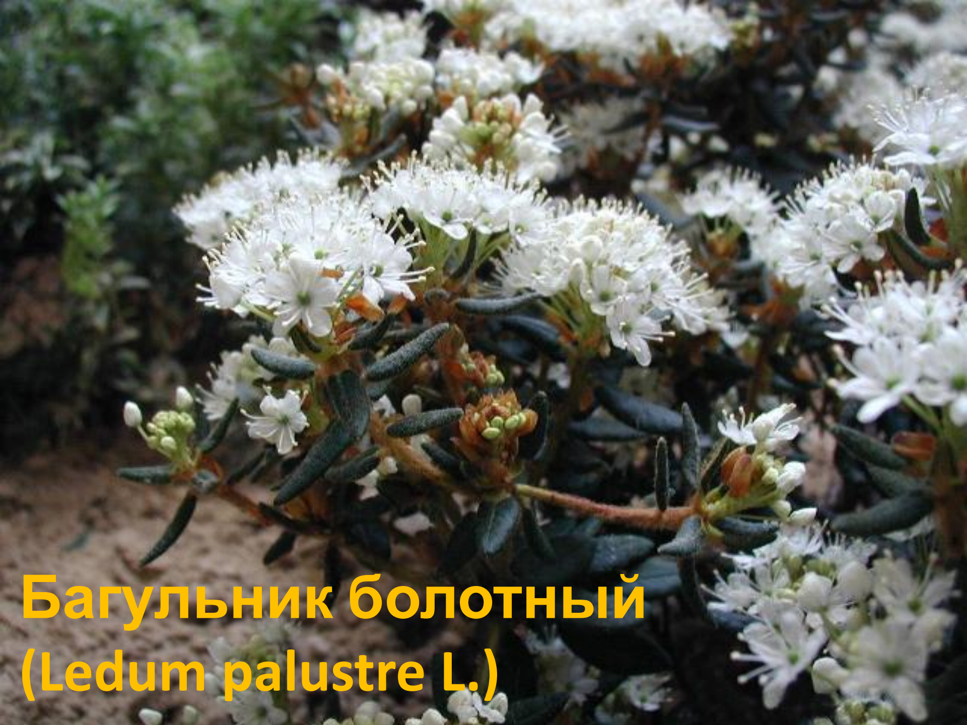
Багульник болотный ( Ledum palustre L.)