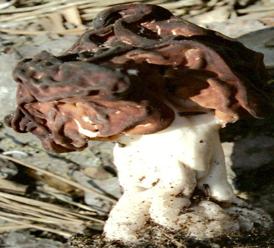
Строчок обыкновенный ( Gyromitra esculenta Fr.)