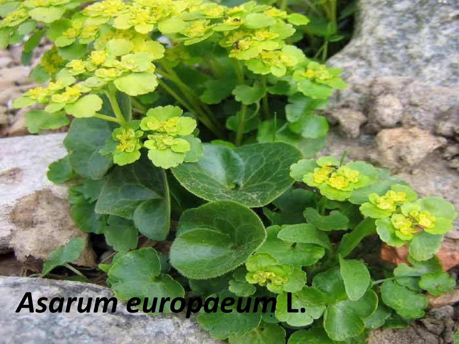
Asarum europaeum L.