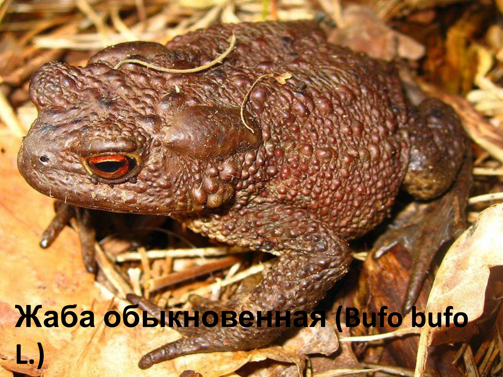
Жаба обыкновенная (Bufo bufo L.)