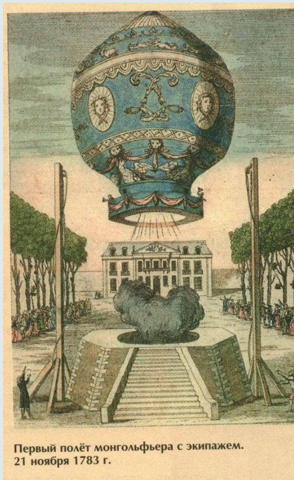
Первый полёт монгольфьера с экипажем. 21 ноября 1783 г.